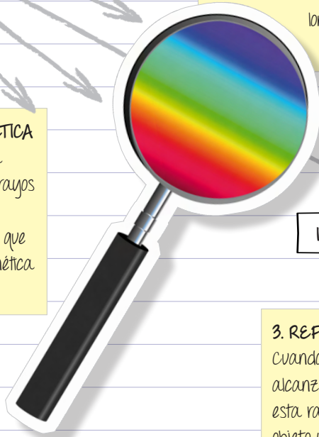
Luz blanca incidente

La luz visible es un tipo de onda electromagnética (igual que los rayos X, las microondas, las ondas de radio o la radiación ultravioleta) que transporta energía electromagnética de un lugar a otro.